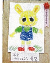
スケッチ大会のモデルになって大忙しのチャタロウ。左の写真は受賞された作品。描いてくれた皆さんありがとうございます!!