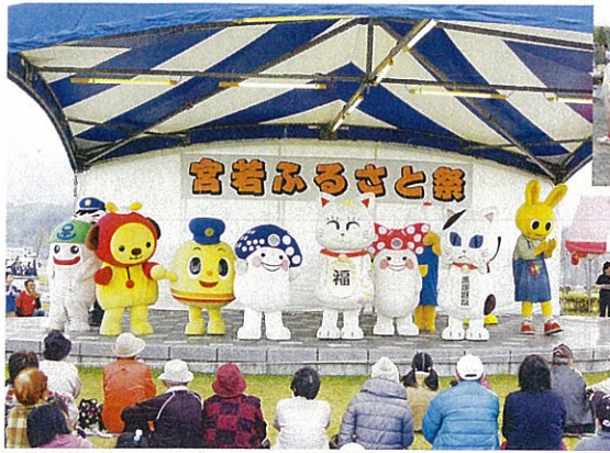
人気のゆるキャラが勢ぞろい。会場内では記念撮影も。

オープニングは鞍手高校吹奏楽部による演奏で飾られ、チャタロウも、レインボーカンパニーの子どもたちと一緒にミュージカルに挑戦しました。他にも餅投げ