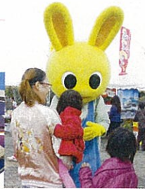
ここでもチャタロウは人気者でした。