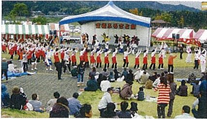
総踊りで「炭坑節」を踊ると会場に一体感が!!

天気はぐずついていたようですが、会場となった西鞍の丘総合運動公園は、たくさんの人達でにぎわいました。次回の宮若ふるさと祭が今から楽しみです!